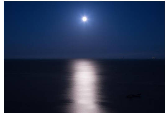
静岡県主催「ふじのくにエンゼルパワースポット総選挙」 行ってみたい部門第一位のムーンロードを一望。

*2名1室・1泊2食おひとり料金（税込）、入湯税150円別、休前日4500円UP